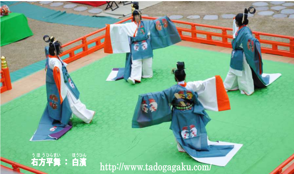
うほうひらまい ほうひん 右方平舞：白濱